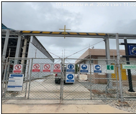
ป้ายเตือนความปลอดภัยบริเวณสถานี