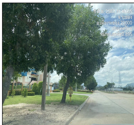
ป้ายแสดงตำแหน่งแนวท่อส่งก๊าซธรรมชาติ