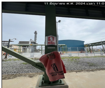
ติดตั้งเครื่องดับเพลิงแบบเคมีผงที่บริเวณสถานีวัดและควบคุมแรงดันก๊าซ (MRS)