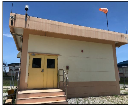
ติดตั้งกล้องโทรทัศน์วงจรปิด เพื่อรักษาระบบความปลอดภัย 24 ชั่วโมง