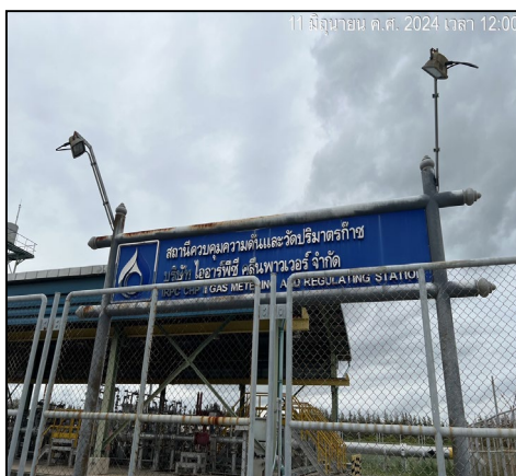
ป้ายสถานีควบคุม