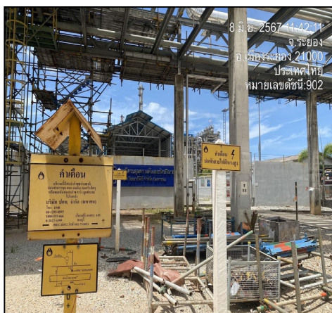
ป้ายแสดงหมายเลขโทรศัพท์แจ้งเหตุที่ชัดเจน